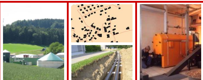
Biogasanlage für die Grundlast